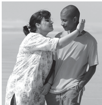
Odile (Christine Citti) et Charley (Baldoméra Gueye). CLAUDE MÉDALE

Le téléfilm de Karim Akadiri Soumaïla raconte cet affrontement dans un décor, une lumière et des costumes « douce France », qui accentuent la violence des rapports qu'instaure d'emblée Julien avec son petit-fils. L'environnement ne cadre décidément pas avec ce qui se joue, comme l'explique le réalisateur : « Comment peut-on s'imaginer dans un pays d'une telle beauté, au regard de la diversité de ses régions, qu'il puisse y avoir des choses aussi laides que le racisme ? »